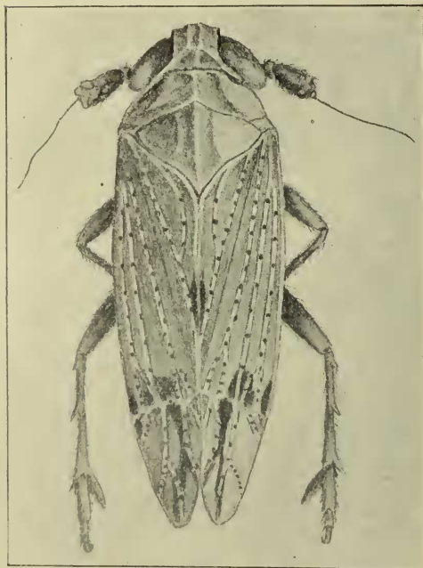
Abb. 1. Langflügelige Form von Conomelus limbatus Fabr.

Ueber die Lebensweise von Conomelus limbatus Fabr. war bisher wenig bekannt, obgleich die Art ziemlich häufig vorkommt. An allen feuchten, von Binsen bestandenen Plätzen wird sie in den Monaten Juli bis September zu finden sein. Die Art fällt durch die stark vortretenden Nerven der Decken auf,